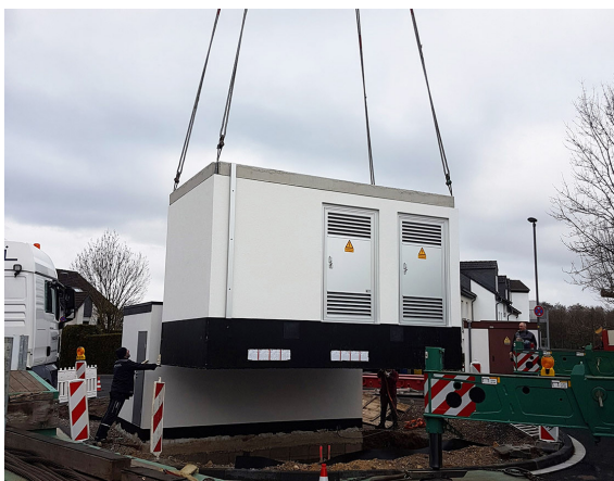
Versetzen eines Containerunterwerks