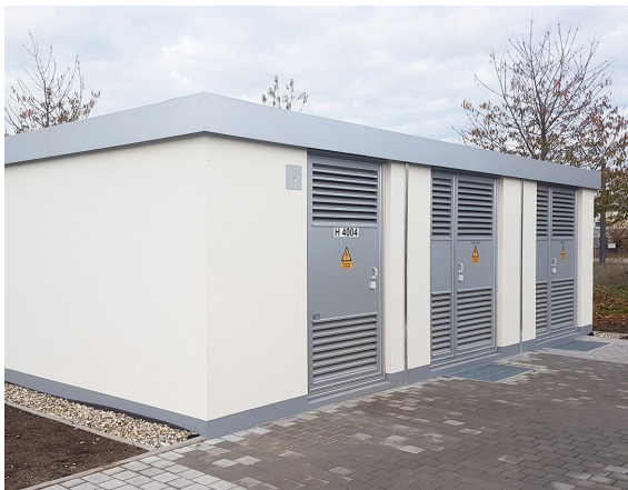
Container aus Beton

Zur Verfügung stehen verschiedene Lackierungen in den standardmäßigen RAL-Farben.