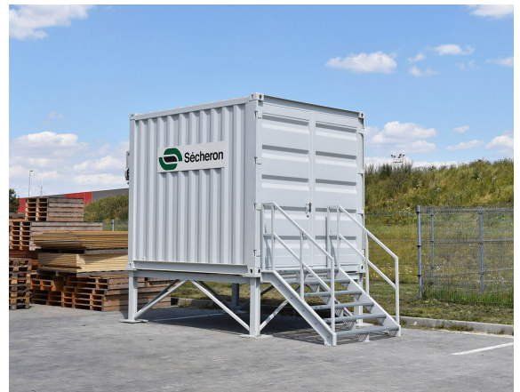
Container aus Stahl

Die Lackierung der Außenwände und der Innenwände ist in verschiedenen RAL-Standardfarben realisierbar.