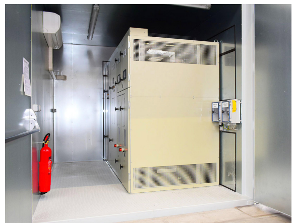
Containerunterwerk mit MBS-Schaltanlage